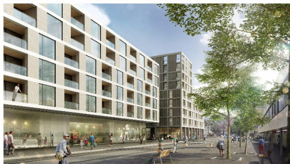
Entwicklungsprojekt Meinen-Areal, Bern (ca. CHF 100 Mio.)